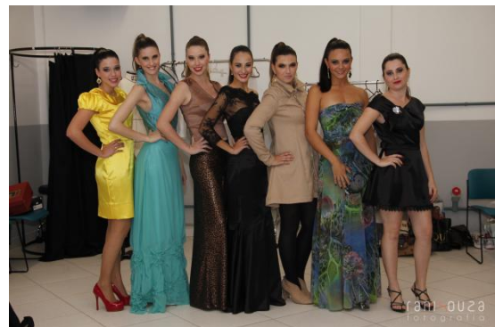
Modelos com os looks produzidos pelas alunas do curso de Modelagem do Vestuário

No dia 05 de agosto aconteceu o desfile de encerramento do curso do Técnico concomitante em Modelagem do Vestuário. O evento marcou a finalização do curso e também a recepção dos calouros do semestre letivo 2013-2.