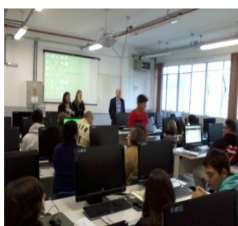
Turma PRONATEC Operador de Computador

Já no curso de Operador de Computador serão contemplados conhecimentos de Informática básica, incluindo operação de sistemas operacionais, pacote de escritório e internet.