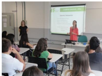
Turma PRONATEC Auxiliar Administrativo

funções de apoio administrativo e operar sistemas de informações gerenciais com foco na gestão da qualidade.