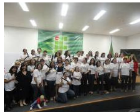
Alunas formadas no Programa Mulheres Mil

No dia 25 de abril, o Câmpus Gaspar realizou a primeira formatura das alunas do Programa Mulheres Mil. Cento e duas alunas formaram-se nos seguintes cursos: "Introdução ao Programa Mulheres Mil, em que foram ofertadas aulas de economia doméstica, saúde e meio ambiente; "Curso de Informática Básica e Mídias Sociais", "Curso de Gestão Doméstica e Saúde da Família" e "Modelagem Básica".