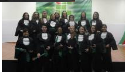
Turmas de formados em Administração, Informática e Vestuário

No dia 25 de abril, o Câmpus Gaspar realizou a primeira formatura das alunas do Programa Mulheres Mil. Cento e duas alunas formaram-se nos seguintes cursos: "Introdução ao Programa Mulheres Mil, em que foram ofertadas aulas de economia doméstica, saúde e meio ambiente; "Curso de Informática Básica e Mídias Sociais", "Curso de Gestão Doméstica e Saúde da Família" e "Modelagem Básica".