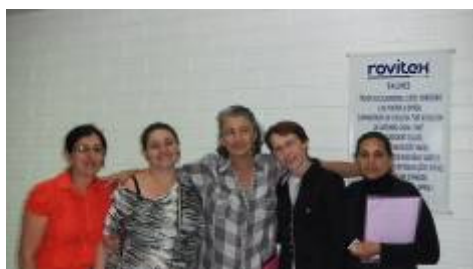
Visita das alunas do Programa Mulheres Mil à Rovitex

Visita ao Museu da Hering: As alunas da 3ª fase do Curso Técnico em Vestuário Integrado ao Ensino Médio realizaram uma saída de campo no dia 10 de abril de 2013, ao Museu da Hering em Blumenau. As alunas tem como desafio no Projeto Integrador desse semestre a criação e ambientação de Salas