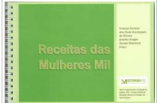
Capa do livro de receitas das Mulheres Mil

No dia 25 de abril ocorreu o lançamento do livro "Receitas das Mulheres Mil", resultado do projeto de extensão "O estudo da nutrição através de um livro de receitas confeccionado pelas alunas do Programa Mulheres Mil", uma parceria entre o IFSC Câmpus Gaspar e a Universidade Regional de Blumenau, FURB.