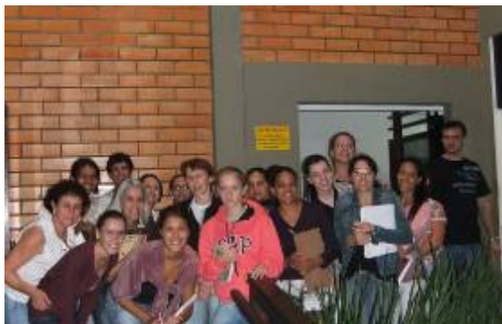
Visita dos alunos 2ª fase do curso técnico em Modelagem do Vestuário

Visita à empresa Rovitex: no dia 08 de abril a 2ª fase do Técnico em Modelagem do Vestuário e as alunas do Mulheres Mil, do curso de Modelagem Básica, visitaram a empresa Rovitex, em Luis Alves, onde conheceram os setores de Fiação, Tecelagem de Malha, depósitos de fibras e malha, beneficiamento, estamparia, corte, bordado e costura.