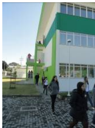
Evacuação do prédio

A atividade auxilia para que os alunos vejam na prática uma aplicação da unidade curricular de HSS. Anteriormente, os alunos já haviam tido aulas de segurança com os bombeiros da região.